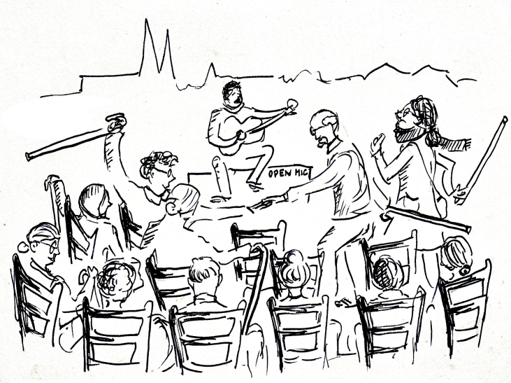
Open Mic POTRVÁ veřejnou službu pro Prahu 6 radostně plní. | Kresba: Martina Trchová

Že má naše hudební líheň smysl, dokládá i živý zájem ze strany vybraných letních festivalů . Tak se mohou díky Open Micu představit mnozí písničkáři v rámci Porty, Boskovic, Střelického strunobraní či United Islands of Prague. O tom jsme více psali v září.