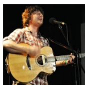
Open Mic POTRVÁ #66 5. 9. 2013