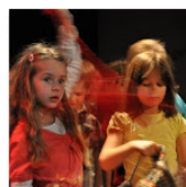
Open Mic POTRVÁ #64 1. 5. 2013