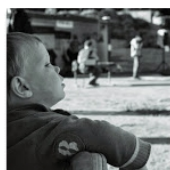
Open Mic na Folimance