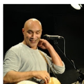
Open Mic POTRVÁ #67 2. 10. 2013

www.openmic.eu www.picasaweb.google.com/openmicnaprahu