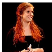
Open Mic POTRVÁ #65 7. 6. 2013